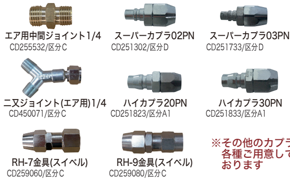
エア用中間ジョイント1/4 CD255532/区分C