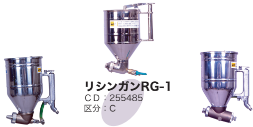
マルチガンMG-1 CD : 255488 区分 : C